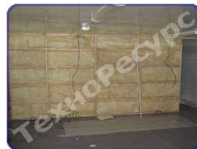
Установка дополнительного утепления