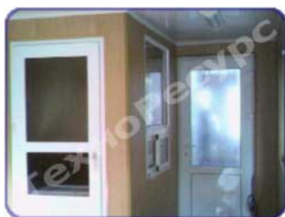
Внутренняя отделка постов охраны

- пол – покрыт линолеумом (влагопароизоляция, утеплитель URSA 100 мм по объему).