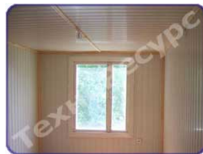
Стены обшиты ПВХ панелями, окна - пластиковый стеклопакет