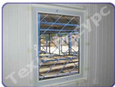
Установка ПВХ стеклопакетов