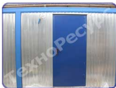
Установка стальной входной двери