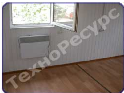
Установка электрического обогревателя

Шлагбаумы используют для регулирования въезда/выезда на автостоянках и парковках, в гаражных комплексах и других объектах с интенсивным транспортным потоком. Автоматический шлагбаум оборудуется правосторонней или левосторонней стрелой. Длина стрелы от 2,5 до 6 метров в зависимости от ширины проезда, который необходимо перегородить с помощью шлагбаума. Шлагбаум может управляться любой системой контроля доступа: считывателем карточек, кодовой клавиатурой, комплектов фотоэлементов, ключом-выключателем, а так же при помощи радиобрелка.