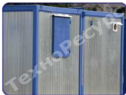
Установка металлических ставней на окна