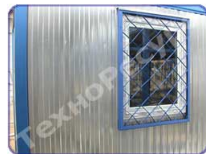
Установка металлических решеток